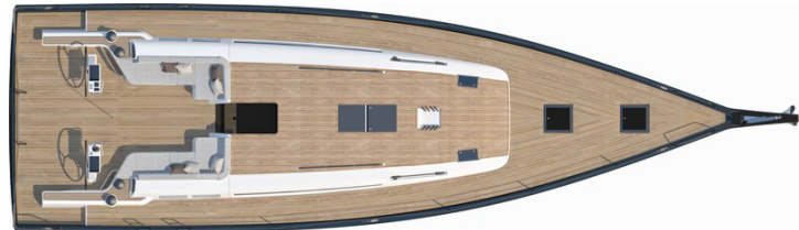
Version 3 cabines 2 salles d'eau :