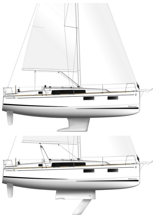
Gommone - Opzione: Rollbar