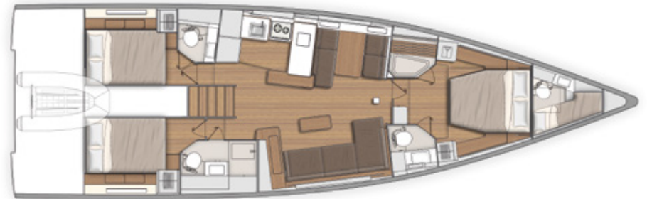
LOWER DECK - 3 CABINS / 3 HEADS PONT INFÉRIEUR - 3 CABINES / 3 SALLES D'EAU